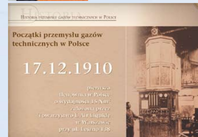
Slajd z prezentacji T.Steinhoffa pt. „Historia”